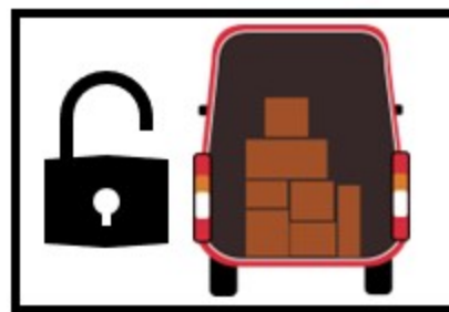
6. Отключете вратите