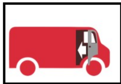
3. Отворете врата, излезте от вана, затворете вратата