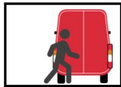
5. Отидете до задните врати