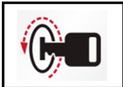
1. Изгасете двигателя