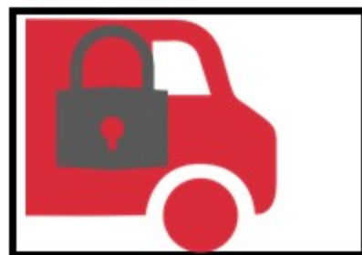
4. Заклучете вратите